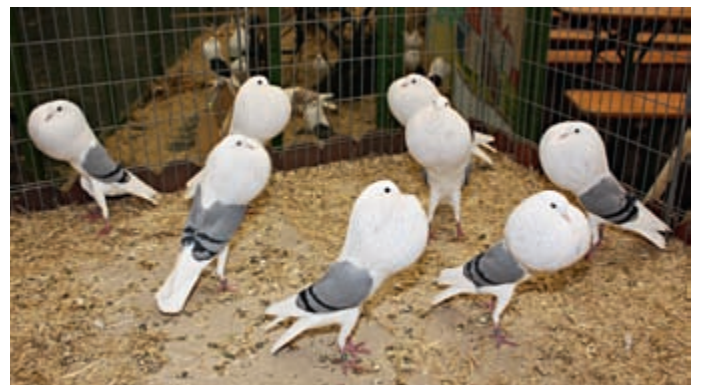
Voliere Voorburger Schildkröpfer, blau mit schwarzen Binden, v SB (Franz Liebl, Grattersdorf)

zahl wie die Blauen ohne Binden (39). In beiden Flügelzeichnungsmustern sah man mehrere rassige Vertreter mit richtigem Typ und gut gedeckten Augenrändern. Letztere Position musste allerdings verein-