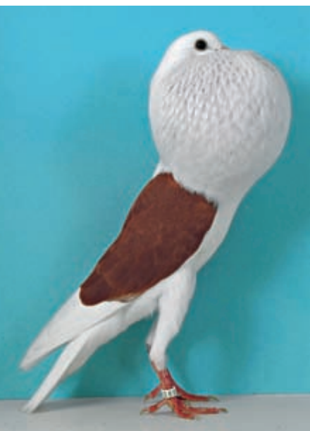
0,1 Voorburger Schildkröpfer, rot, v LVE (Paul Herdegen, Oberwössen)

Von den 452 gemeldeten Voorburger Schildkröpfen waren 35 Schwarze gemeldet und auch anwesend. Sie waren von den Ausstellern gut ausgewählt, da nur 3 Tieren 5 und mehr Punkte wegen Abweichungen von der Standardfestschreibung abgezogen wurden.