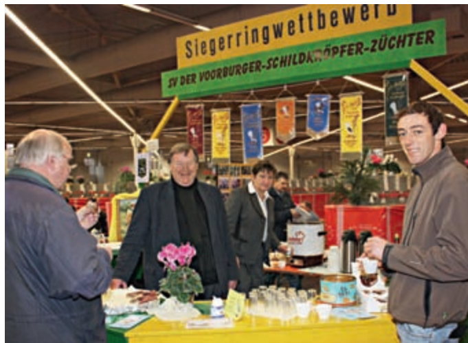
Der SV-Informationstand lud zum Verweilen ein

Wenn auch Typ, Blaswerk und Haltung an vorderster Stelle bei den Voorburger Schildkröpfen stehen, beinhaltet die Wirkung der Schildfarbe bei den Rotfahlen (73) schon den Vorteil des ersten Eindruckes zur Festlegung der Punktzahl – gewollt oder auch ungewollt. Dabei ist ein auffälliger Blauton im aschfarbenen Flügelschild, insbesondere bei den Täubern, nicht vorteilhaft. Unabhängig davon zeichneten feine schlanke Körper mit richtigen Proportionen und