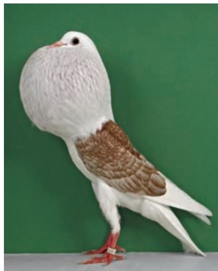
0,1 Voorburger Schildkröpfer, rotgesäumt, hv E (Hans-Peter Flauaus, Hähnlein)