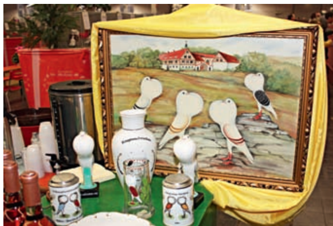
Gemälde und Preise mit Voorburger Schildkröpfen